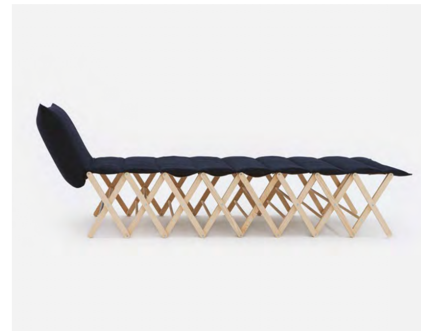
Campeggi, divan Brando, Giuseppe Arezzi, 2024