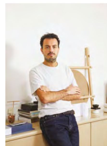
Portrait de Giuseppe Arezzi