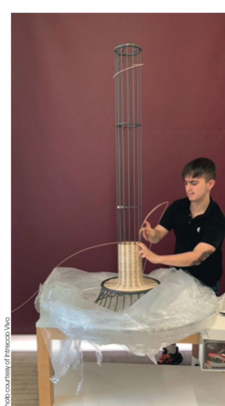
Tutti i materiali di progetto/ All project materials