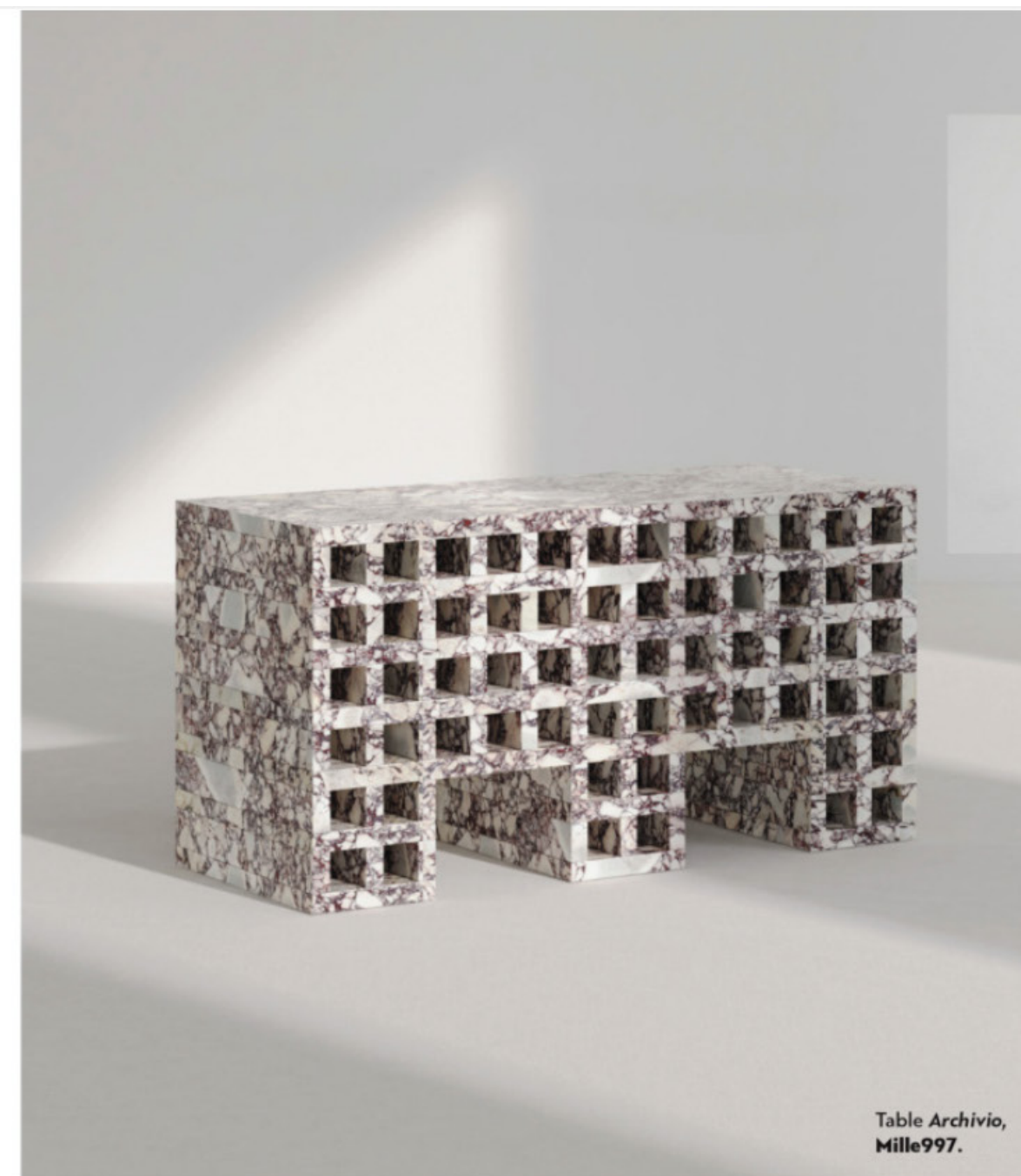
Table Archivio , Mille997.