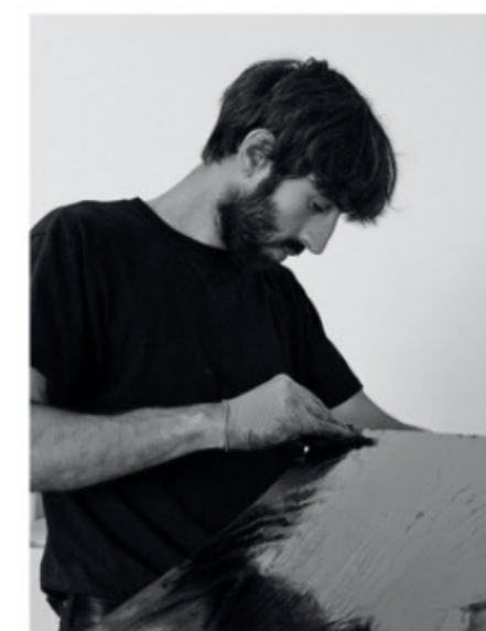
Banc New Wave , Galerie Gosserez.