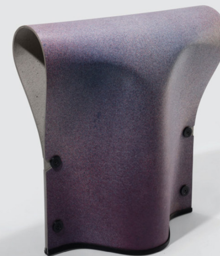
Tabouret Osselet , Galerie Gosserez.